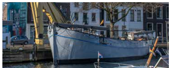
De Balder zonder masten. Inmiddels zijn twee stalen masten geplaatst.

Het aantal vrijwilligers kwam eind 2023 uit op 32 personen. In totaal zijn er dit jaar door de vrijwilligers, inclusief het bestuur, ca.4400 uren ingezet.