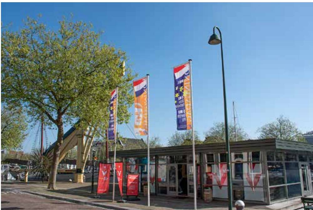
Het paviljoen is in gebruik genomen door Vlaardingen Partners. De Westhavenkade is nu, met Balder en Stadskraan, een fraaie entree van onze stad.

Het team bedrijfsvoering draagt verder zorg voor de financiële administratie, begrotingen en jaarrekening, kas(sa) administratie, personeelszaken, (bruikleen)verzekeringen, inkopen, opstellen offertes voor verhuren, financiële rapportages naar subsidievertrekkers, planning en begeleiding van onderhoud aan alle installaties, ondersteuning bij planning/voorbereiding/opbouw/afbouw van tentoonstellingen, aanpassingen in opstellingen ten behoeve van evenementen, uitvoeren van kleine technische reparaties, hand- en spandiensten, website en kassa, BHV organisatie, roostering floormanagers en bijspringen als achtervang.