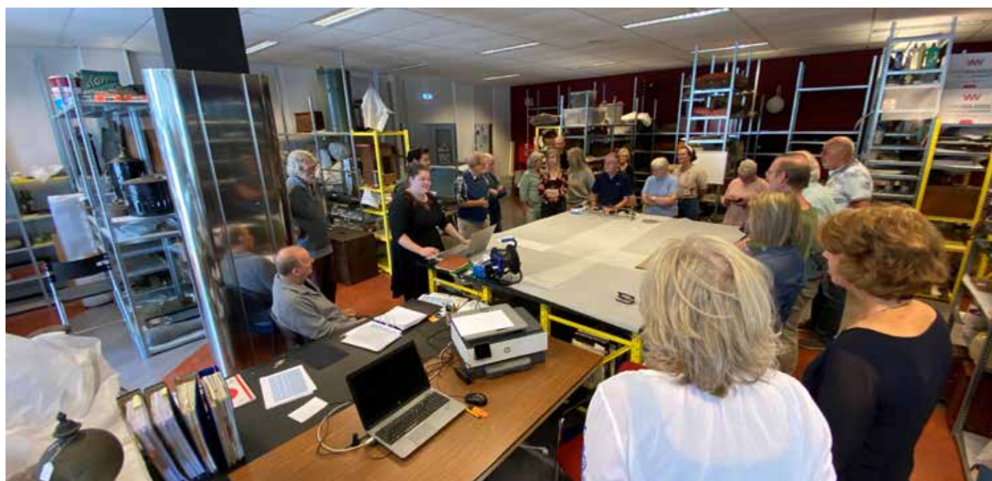
De werkzaamheden voor de herwaardering van de collectie in de fabriek zijn afgerond. Het project werd met een feestje afgesloten.

Met het afronden van het herwaarderingstraject hebben we dus een schone én opgeschoonde collectie die dient als basis voor de verdere versteviging van onze positie als museum van, voor en door alle Vlaardingers. We weten nu beter wat we hebben, maar ook wat we niet hebben. Welke Vlaardingse verhalen kunnen we nu niet vertellen, omdat we daar simpelweg (nog) niets of te weinig van hebben? De komende tijd zullen we ons bij het collectiëren focussen op het wegwerken van deze hiaten.