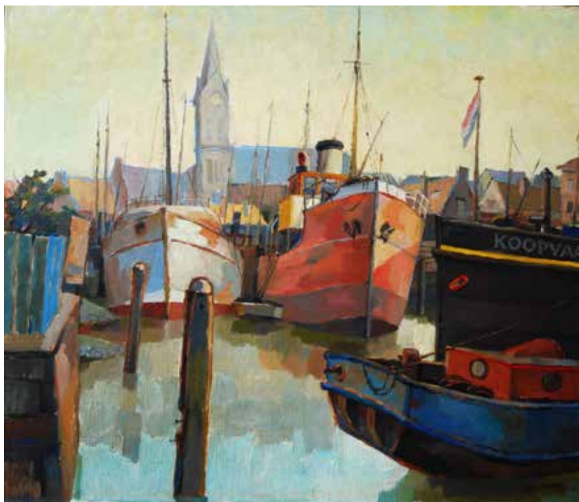
Schepen in Vlaardingen – Leen Droppert